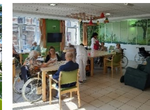
Lieu de vie pour personnes désorientées