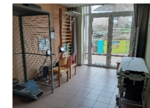
Salle de kinésithérapie