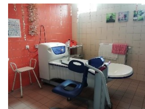
Salle de bain adaptée