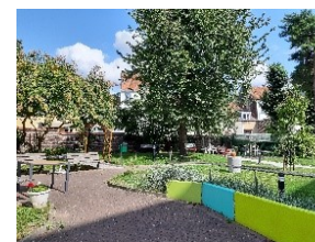
Jardin sécurisé (en intérieur d'îlot)