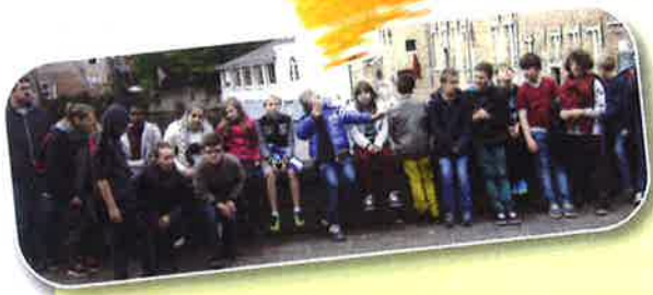
Classes de ville à Bruges pour les « grands » de l'école primaire.

Cette année, les deux classes de « grands » de l'école primaire de Clairval sont parties trois jours à la découverte de la ville de Bruges. Il s'agissait d'un projet mis en œuvre par les élèves avec l'aide de leurs enseignants. En effet, les enfants ont été acteurs de ce séjour à tous points de vue : visites, réservations, activités, contacts... Ils se sont tous mobilisés pour faire de ce projet une réalité.